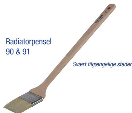
Radiatropensel 90 & 91